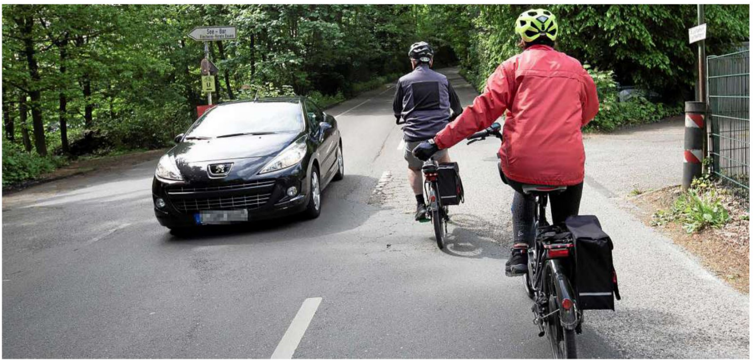
Vom Stauseebogen aus biegen die meisten Radfahrer links ab, um Richtung Baldeneysee zu gelangen, das kann zu gefährlichen Situationen führen.