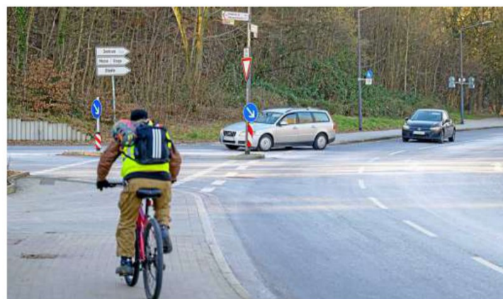
Von der Kampmannbrücke geht es links auf den Abschnitt des Stauseebogens, der zur Fahrradstraße werden soll.