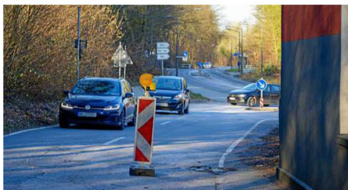
Von der Wuppertaler Straße geht es auf den Stauseebogen, um ins Unterdorf und die Mitte Heisingens zu gelangen.